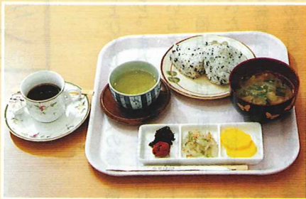
手作りの朝食。おにぎりや漬物、一番だしのおみそ汁が好評

族で宿泊しても負担にならないような料金設定にしました。また、宿泊者は無料で駐車場も利用でき、当ホテルでは、ビジネス料金でリゾート気分を味わうことができます。