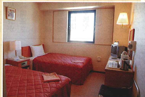
温かみのある、ホッとできる客室