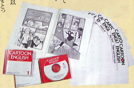
「10時間英語脳育成プログラム」で使用する教材

平成12年8月設立。英会話教室の運営や英語教師の育成、オリジナル教材の作成、英語学習コンテンツの提供、英語学習本の執筆などを手掛ける。 http://www.eiken-inc.com 主な著書/『10時間で英語脳を作る本』『あら、英会話(ヨイシヨ)がお上手ですね。』(SCC出版)、『英語』は絵で考えるとどんどん話せる!』(青春出版社)、[TOEIC(R)テスト730点スコアアップ問題集](成美堂出版)、『英語が好きになる本』(池田書店)など