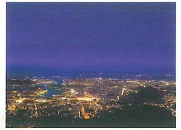
皿倉山からの夜景

「100億ドルの夜景」と称されるその美しさは「新日本三大夜景」の一つに選定されています。