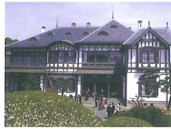
西日本工業倶楽部